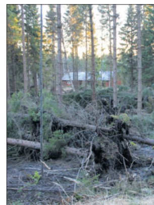
Stora skador. Fallna träd vid Tynglaxvägen på Kimitoön.

Skogsindustrin har under årets lopp informerat om produktionsbegränsningar som är på väg att leda till att hundratals anställda blir permitterade.