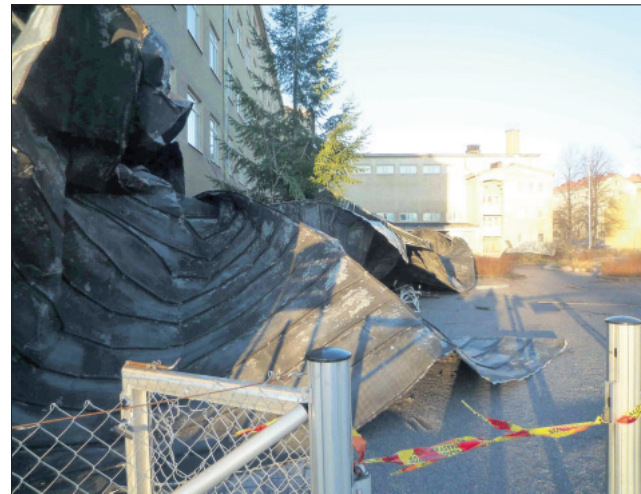
Ingen skadades. Taket på Steinerskolan i Åbo revs loss av stormen.

ska vara reparerat när skolbarnen återvänder från jullovet.