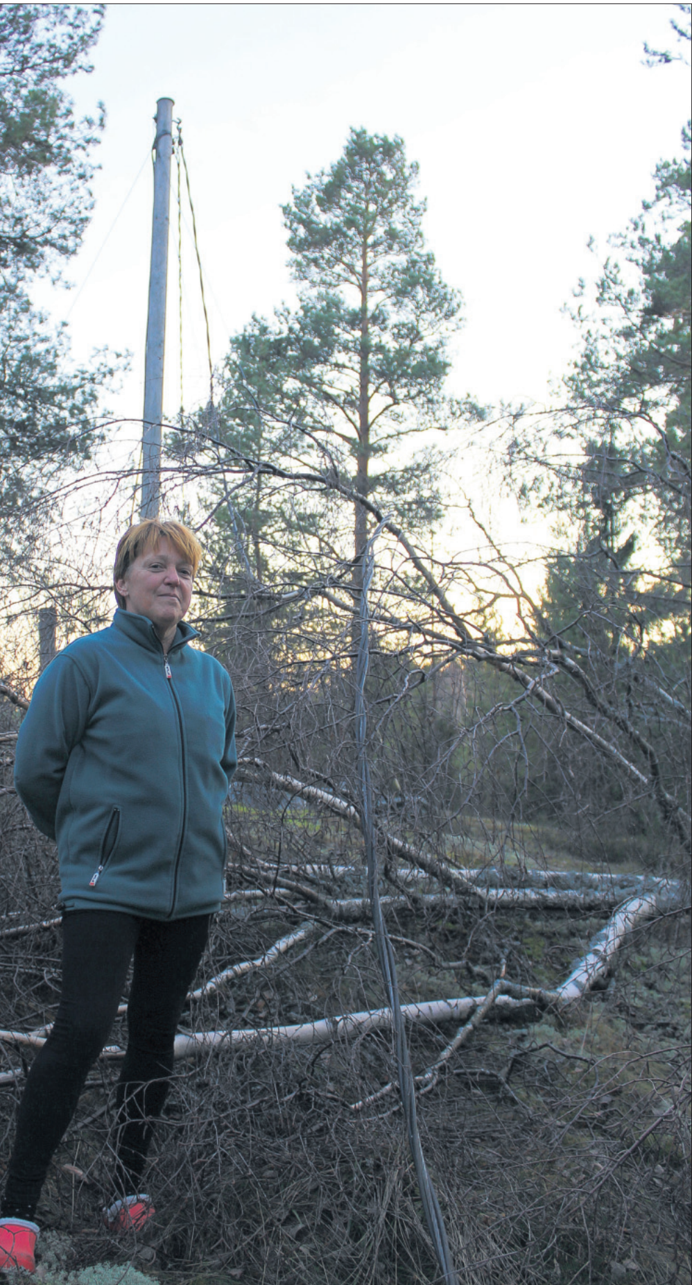
Björkman i Västanfjärd är en av dem som varit utan el i över två dygn, och tror att hon kan