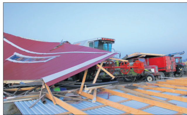
Förstörd maskinhall. I Smedsböle låg maskinhallens väggar och tak några tiotal meter bort.

–Men mycket jobb blir det innan hallen står på nytt, säger Hagman om hallen som bara var några år gammal.